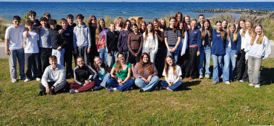
Letzter Termin für die JuHus vor der Jugendfeier: Die Abschlussfahrt nach Kalifornien an der Ostsee.