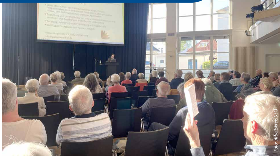
Volles Haus: Die Veranstaltung über den Ambulanten Hospizdienst in Oldenburg war gut besucht.