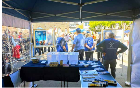
Erfolgreiche Präsenz: Beim Fest am 1. Mai kamen viele Interessierte an den Stand.

es wieder ein kleines und nicht ganz ernst gemeintes Quiz zum Thema Rentenversicherungsbeiträge. Mehr als 40 Stimmen wurden abgegeben. Die große Mehrheit war dafür, sie in ein umlagefinanziertes Rentensystem einzuzahlen.