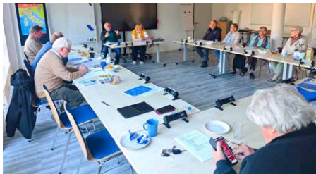
Gut besucht: Die Jahreshauptversammlung in den Räumen der VHS in Lehrte.