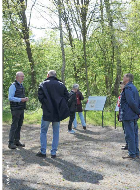
Besuch der Außenstelle des KZ Neuengamme.

Die Sonnenwende wird am 20. Juni im Garten von Schwerdtfegers mit Kaffee und Kuchen sowie abendlichem Grillen gefeiert. Gäste sind willkommen.